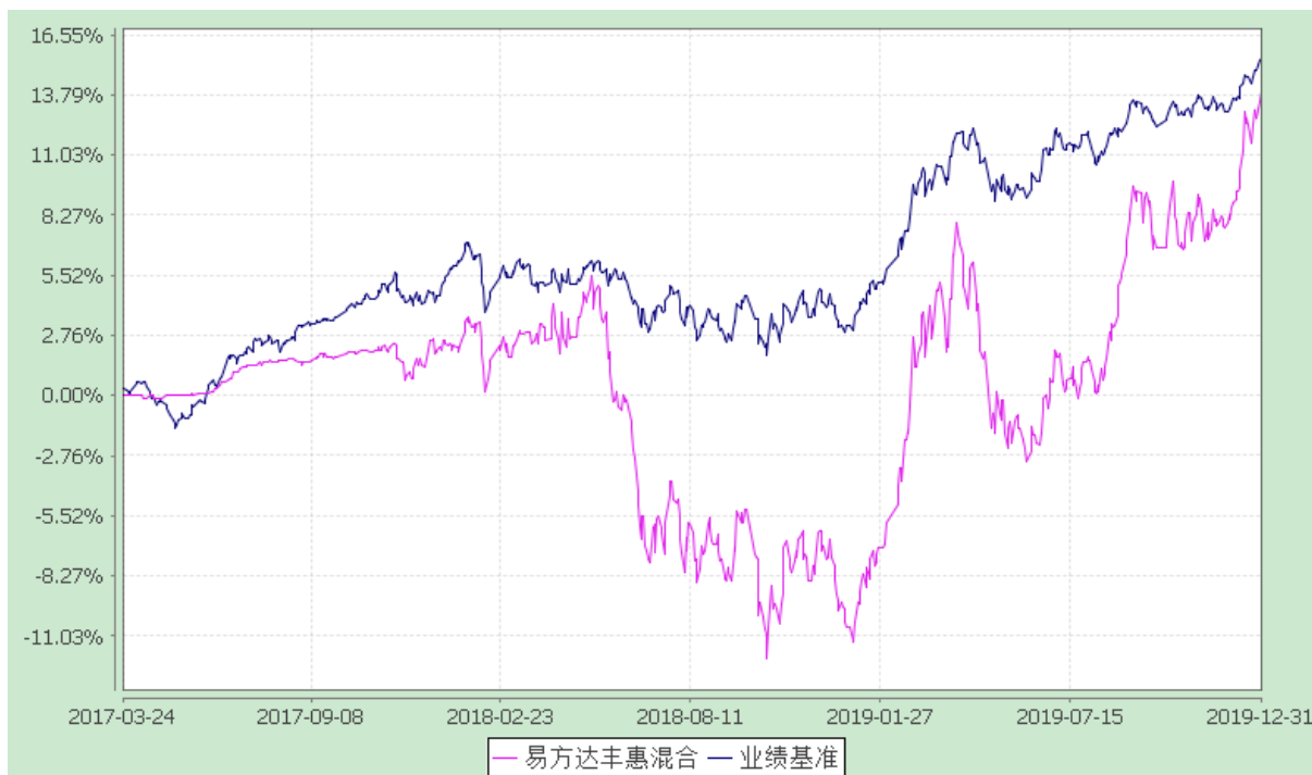
易方达丰惠混合型证券投资基金 份额累计净值增长率与业绩比较基准收益率历史走势对比图 (2017 年 3 月 24 日至 2019 年 12 月 31 日)

注：自基金合同生效至报告期末，基金份额净值增长率为 13.90%，同期业绩比较基准收益率为 15.48%。