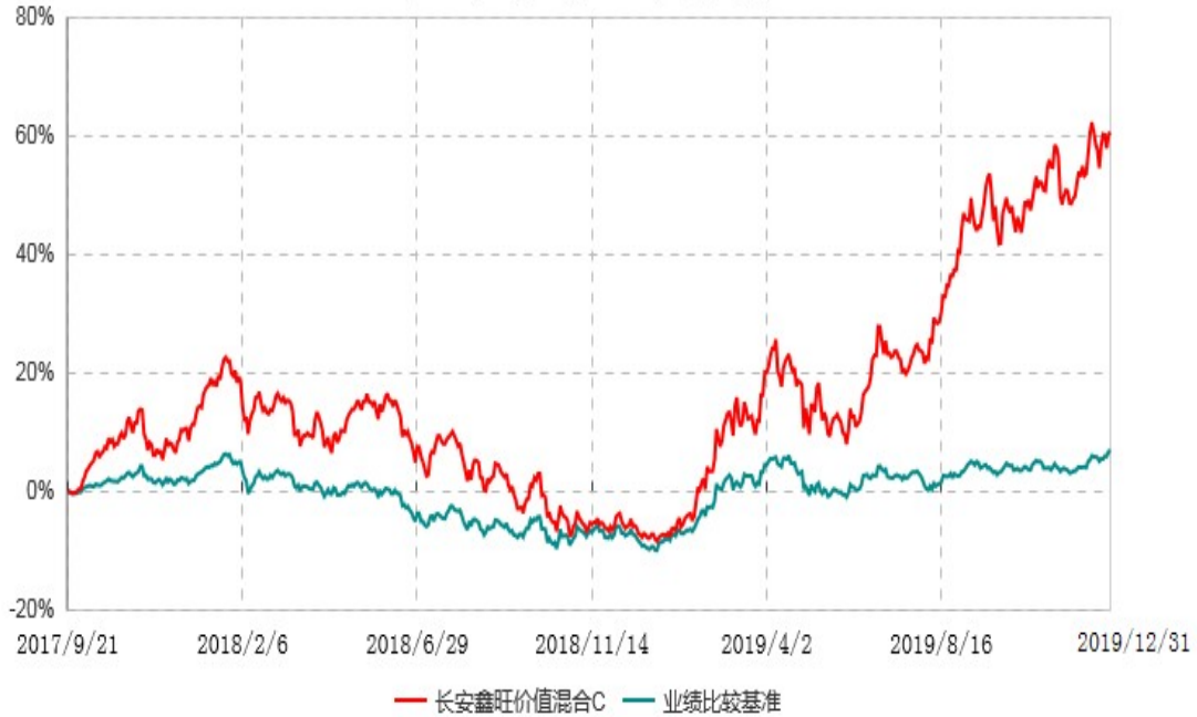
长安鑫旺价值混合C累计净值增长率与业绩比较基准收益率历史走势对比图 (2017年09月21日-2019年12月31日)

根据基金合同的规定,自基金合同生效之日起6个月内基金各项资产配置比例需符合基金合同要求。本基金在建仓期结束后,各项资产配置比例已符合基金合同有关投资比例的约定。基金合同生效日至报告期期末,本基金运作时间已满一年。图示日期为2017年9月21日至2019年12月31日。