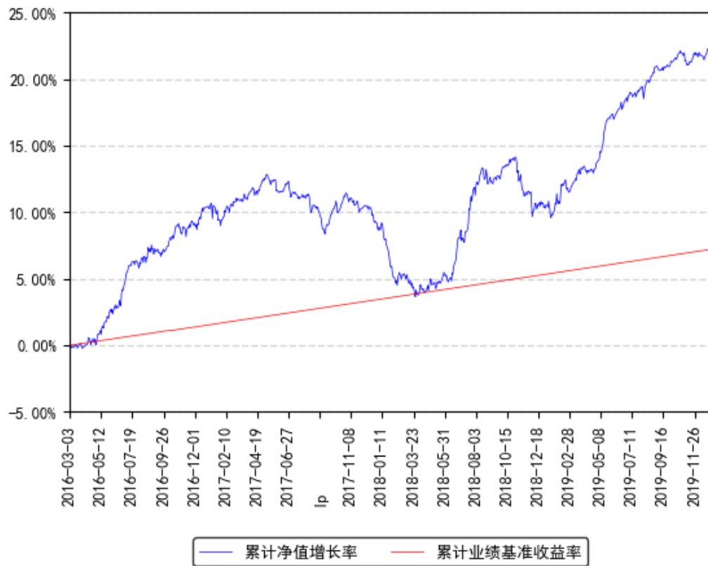
南方亚洲美元债A累计净值增长率与同期业绩比较基准收益率的历史走势对比图