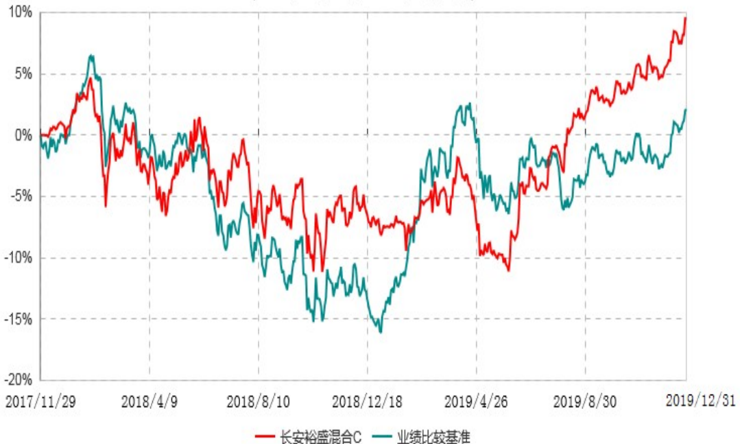
长安裕盛混合C累计净值增长率与业绩比较基准收益率历史走势对比图 (2017年11月29日-2019年12月31日)

根据基金合同的规定,自基金合同生效之日起6个月内基金各项资产配置比例需符合基金合同要求。本基金在建仓期结束后,各项资产配置比例已符合基金合同有关投资比例的约定。基金合同生效日至报告期期末,本基金运作时间超过一年。图示日期为2017年11月29日至2019年12月31日。