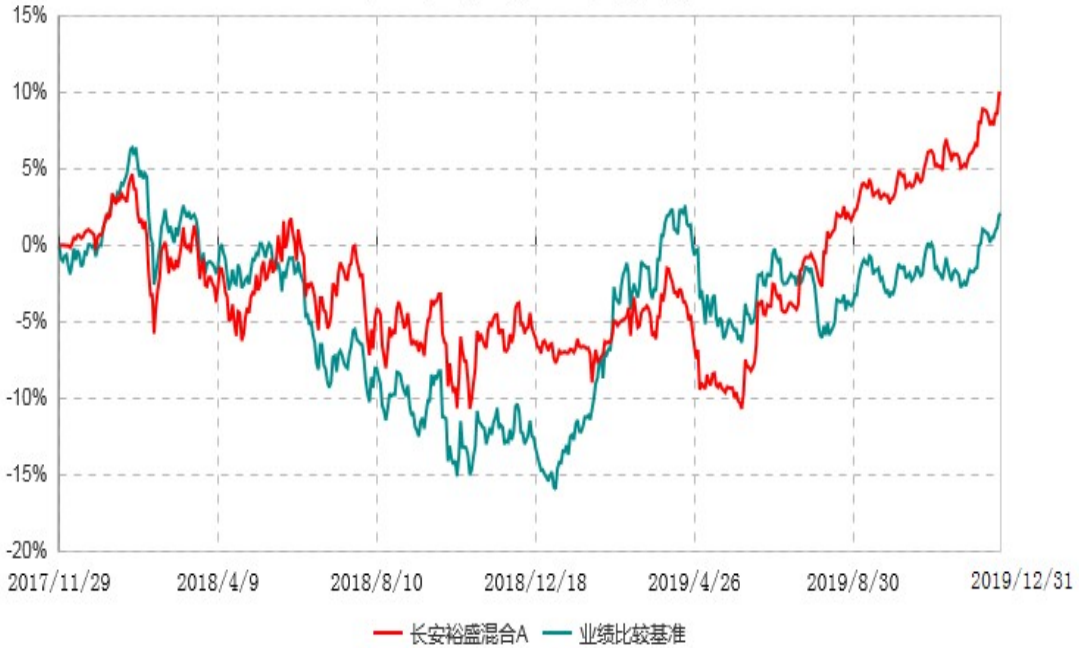
长安裕盛混合A累计净值增长率与业绩比较基准收益率历史走势对比图 (2017年11月29日-2019年12月31日)

根据基金合同的规定,自基金合同生效之日起6个月内基金各项资产配置比例需符合基金合同要求。本基金在建仓期结束后,各项资产配置比例已符合基金合同有关投资比例的约定。基金合同生效日至报告期期末,本基金运作时间超过一年。图示日期为2017年11月29日至2019年12月31日。