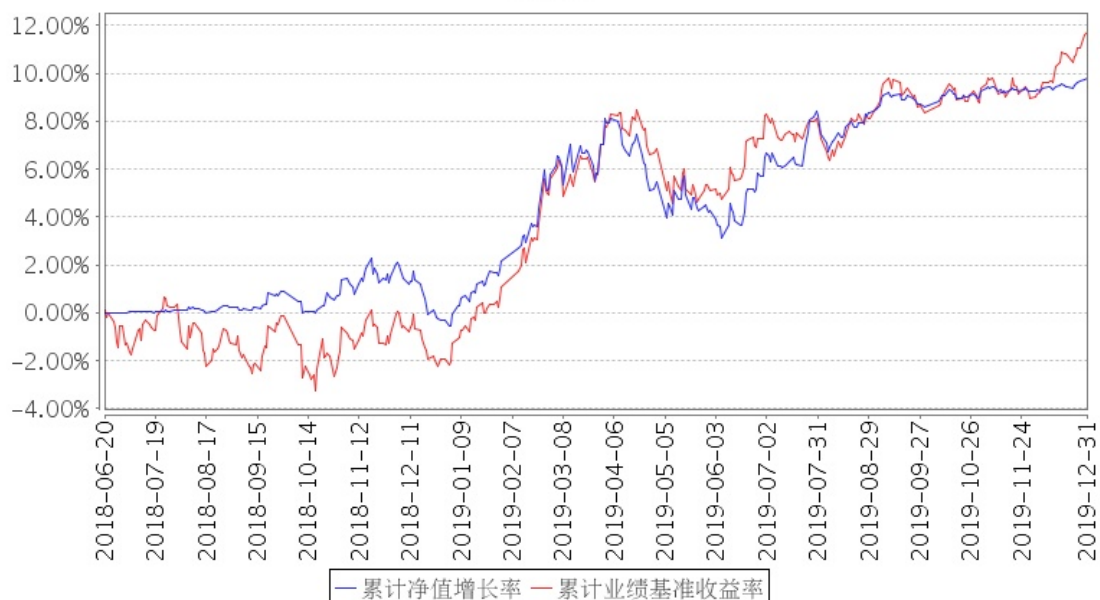
招商丰茂灵活混合发起式A累计净值增长率与同期业绩比较基准收益率的历史走势对比图