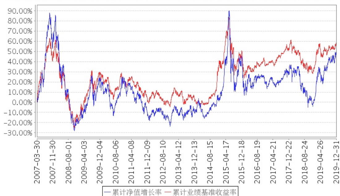
招商核心价值混合累计净值增长率与同期业绩比较基准收益率的历史走势对比图