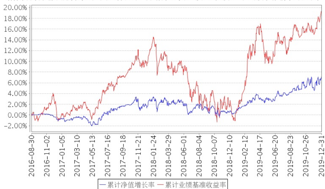
招商睿祥定开混合累计净值增长率与同期业绩比较基准收益率的历史走势对比图