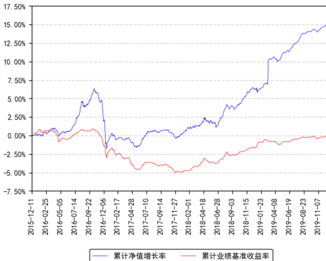
南方弘利A累计净值增长率与同期业绩比较基准收益率的历史走势对比图

注：根据南方基金管理股份有限公司 2018 年 1 月 24 日发布的《南方弘利定期开放债券型发起式证券投资基金基金份额持有人大会表决结果暨决议生效的公告》，本基金于 2018 年 2 月 28 日由南方弘利定期开放债券型发起式证券投资基金转型为南方弘利定期开放债券型发起式证券投资基金（机构定制基金），原基金的净值表现沿用至今。