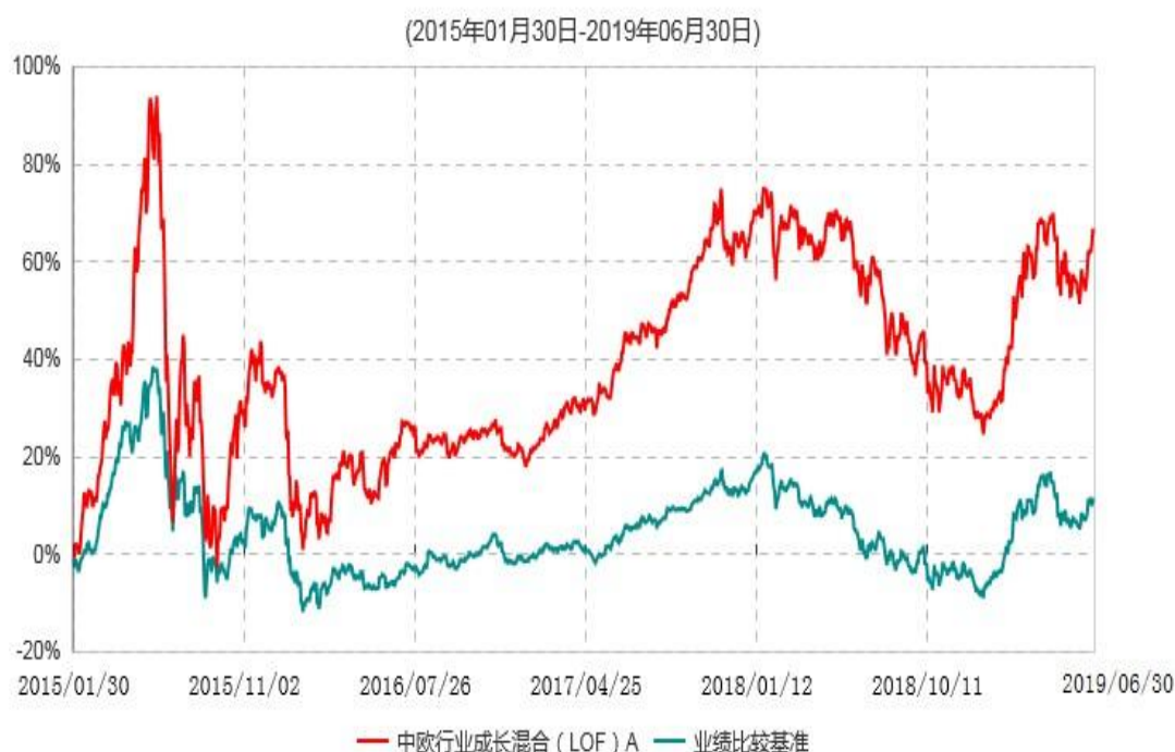
中欧行业成长混合(LOF)A累计净值增长率与业绩比较基准收益率历史走势对比图