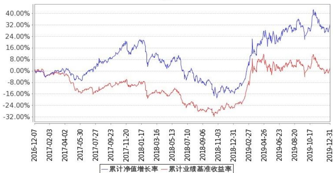
图：嘉实农业产业股票基金份额累计净值增长率与同期业绩比较基准收益率的历史走势对比图