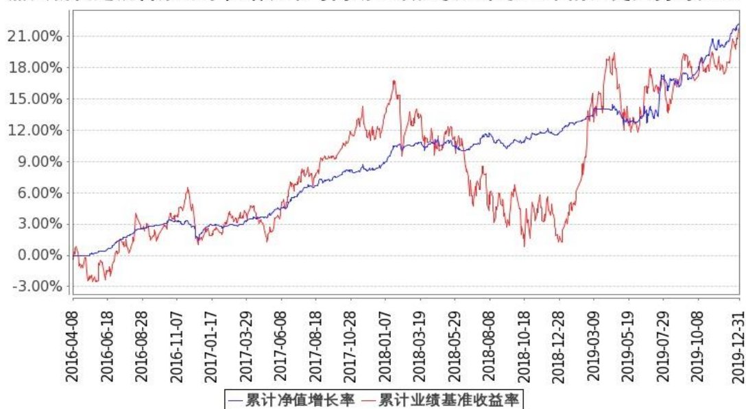
图：嘉实新优选混合基金份额累计净值增长率与同期业绩比较基准收益率的历史走势对比图