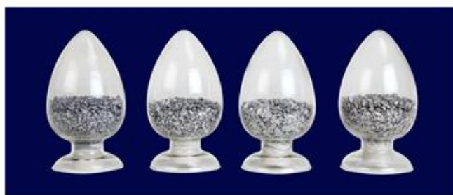
航空航天级特种中间合金

航空航天级高品质钛合金和高温合金用中间合金是公司主要研发的产品之一，包括以钒铝、钼铝等为代表的二元合金和以钒铝锡铬、铝钼钒铬铁等为代表的多元合金。公司目前已投资完成了国内领先的特种中间合金生产线建设，公司现有装备水平、技术能力和产品质量均位列国内前列。尤其是技术含量高，开发难度大，市场潜力大的系列多元合金的研制成功，使公司的技术实力和市场开发能力有了进一步的提升。客户采用本公司独立研发的多元合金已成功用于制作航空航天发动机排气塞、喷嘴构件以及紧固件等关键部件，产品质量已通过验证，公司航空航天级特种中间合金产品技术质量水平达到了世界先进。