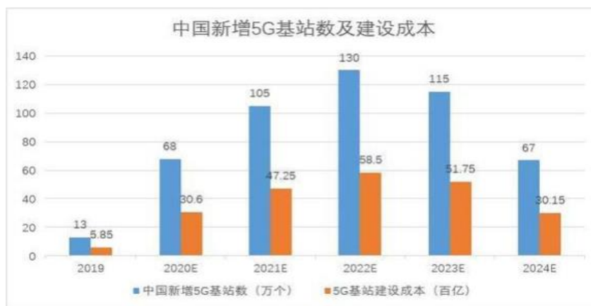
-数据来源前瞻产业研究院，新材料在线编辑整理

自2015年9月我国首次提出要力争在2020年实现5G商用以来，5G技术一直是国家的重要战略发展方向之一。2019年6月，中国工业和信息化部（工信部）正式宣布发放5G商用牌照，中国正式进入5G时代，各大运营商已开始加紧布局5G基站。目前国内三大运营商已经明确2019年5G 投资预算，共计达到410亿元。5G建设将在2020年进入规模化建设周期，根据三大运营商的规划，5G 基站部署将在东部沿海地区和华中地区首先展开，并向西扩展，逐渐实现全国覆盖。根据赛迪顾问的预测，5G 建设的投资预计将会超过一万亿元，其中基站天线投入将达到885亿元。