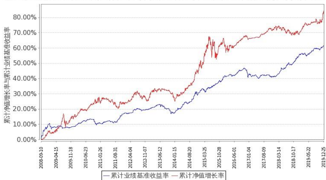
图 2: 嘉实多元债券 B 基金份额累计净值增长率与同期业绩比较基准收益率的历史走势对比