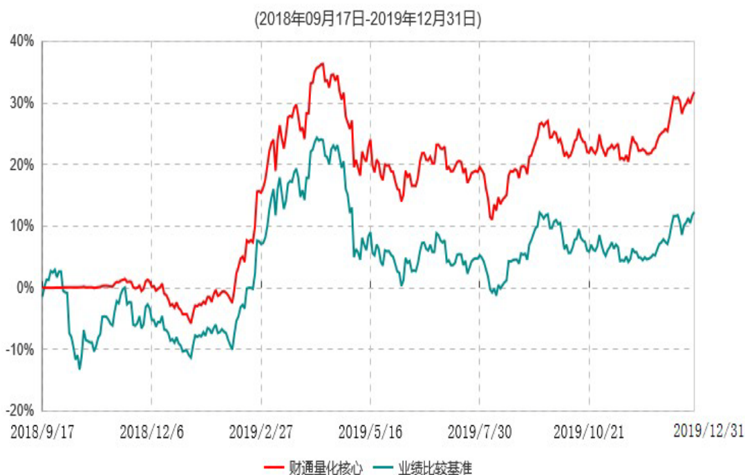
财通量化核心优选混合型证券投资基金累计净值增长率与业绩比较基准收益率历史走势对比图