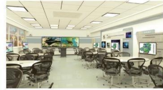
鸿合互动教学解决方案