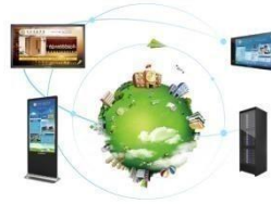
鸿合校园数字媒体发布系统