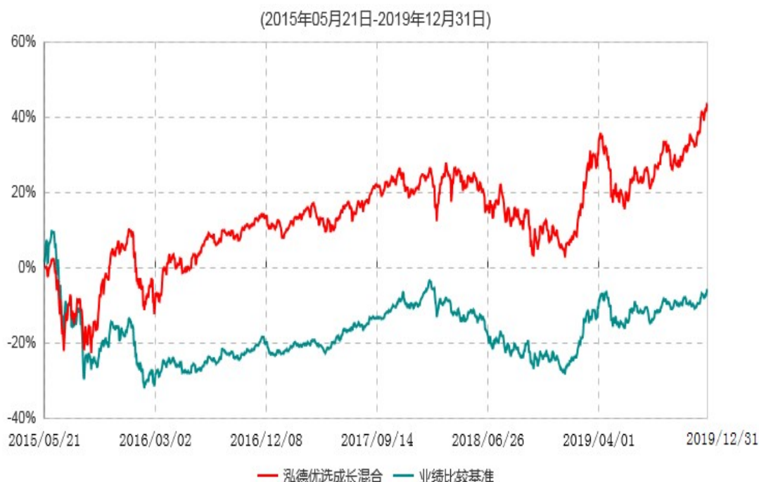
泓德优选成长混合型证券投资基金累计净值增长率与业绩比较基准收益率历史走势对比图

注：根据基金合同的约定，本基金建仓期为6个月，截至报告期末，本基金的各项投资比例符合基金合同关于投资范围及投资限制规定。