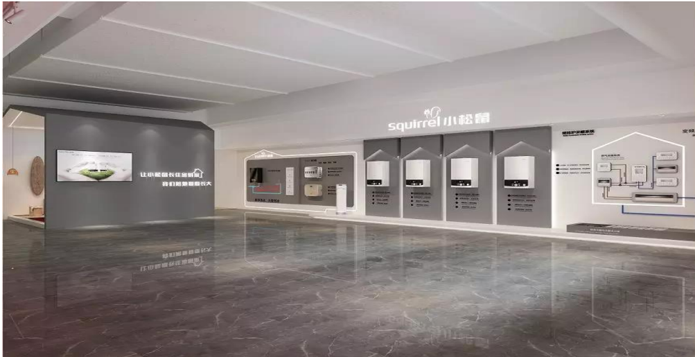
图 9：“小松鼠”产品西安体验中心