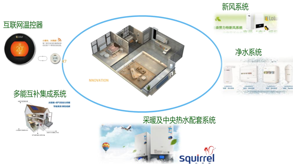
图 6：智能舒适家居制造及服务示意图

公司智能舒适家居领域涵盖壁挂炉、空气源热泵、新风机、净水机等产品。全资子公司迪森家居以“冷、暖、风、水、智”为理念，致力于为家庭用户提供健康、舒适、智能的家居系统解决方案。