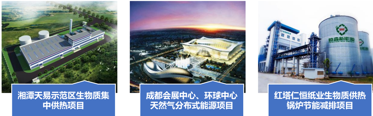
图 2：公司主要清洁能源投资及运营项目

报告期内，公司投资及运营项目共 74 个，其中尚在建设阶段的运营项目 17 个，已投入运营项目 57 个。公司主要运营项目有子公司世纪新能源天然气分布式能源项目，主要为商业客户提供冷热电三联供服务；公司红塔项目，主要为红塔仁恒纸业提供供热（生物质能）服务；子公司武穴瑞华迪森新能源科技有限公司运营项目，主要为武穴工业园区提供热电联产集中供热服务。子公司湘潭聚森清洁能源供热有限公司运营项目，主要为湘潭天易示范区提供集中供热（生物质能）服务。