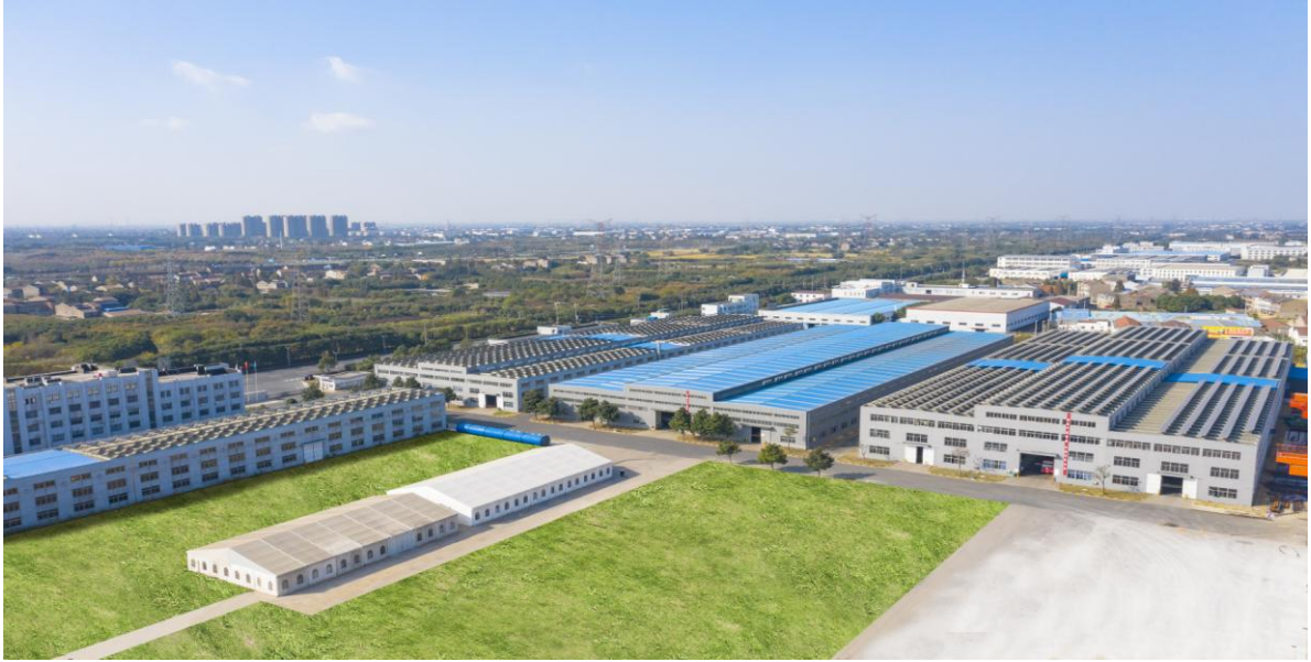
图 3：迪森（常州）锅炉制造基地

报告期内，公司可转债项目“年产 20,000 蒸吨清洁能源锅炉改扩建项目”正在稳步推进，子公司迪森设备已整体搬迁及转移至迪森（常州）锅炉。公司积极推进业务整合，提高产能，提升公司装备制造能力及核心竞争力，努力将迪森（常州）锅炉打造成公司清洁能源应用装备的研发制造基地。