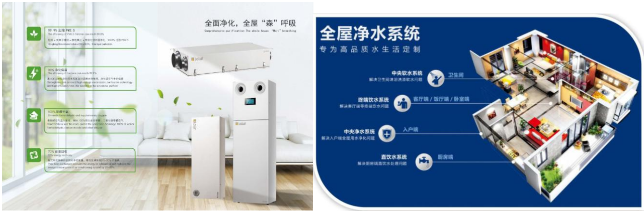
图 7: 新风净水解决方案示意图

报告期内，公司始终注重产品质量，以技术驱动产品创新，以信息化、智能化保证产品质量，旗下“小松鼠”壁挂炉实现总销量突破 200 万台，“小松鼠”荣获“2019 年度中国家电磐石奖之卓越品质奖”“2019 年度中国家电磐石奖之渠道价值奖”等荣誉。