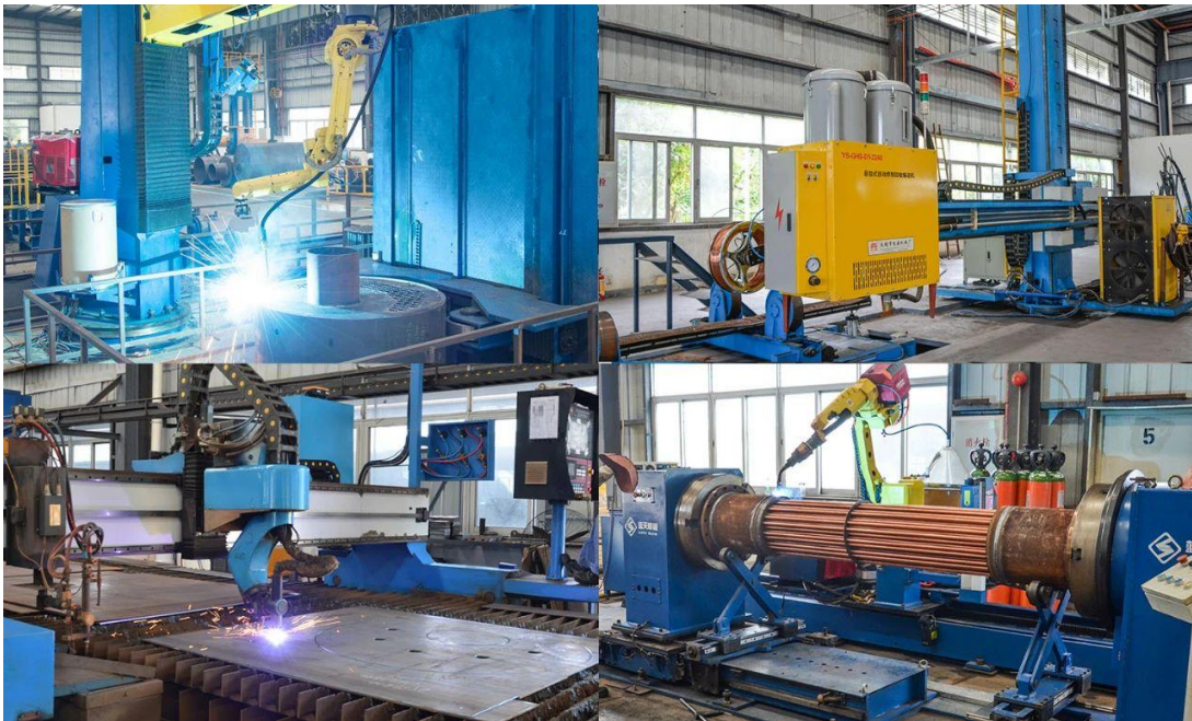
图 4：自动化机器人锅炉生产线

报告期内，公司可转债项目“年产 20,000 蒸吨清洁能源锅炉改扩建项目”正在稳步推进，子公司迪森设备已整体搬迁及转移至迪森（常州）锅炉。公司积极推进业务整合，提高产能，提升公司装备制造能力及核心竞争力，努力将迪森（常州）锅炉打造成公司清洁能源应用装备的研发制造基地。