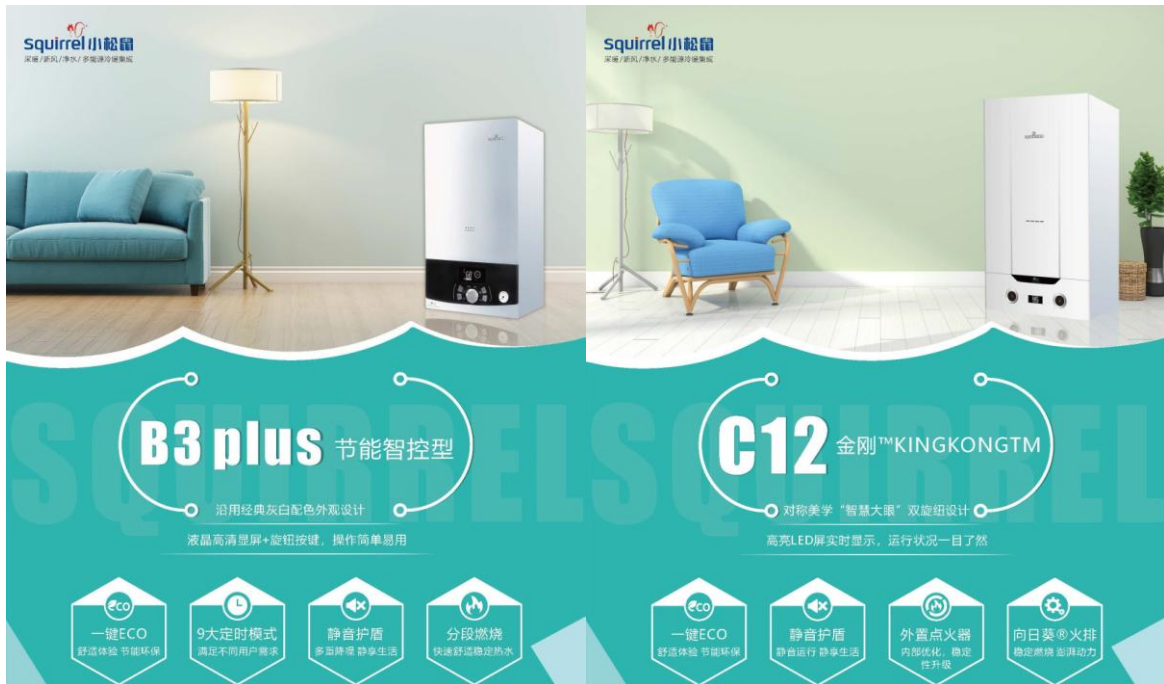
图 8: “小松鼠”获奖产品

报告期内，公司始终注重产品质量，以技术驱动产品创新，以信息化、智能化保证产品质量，旗下“小松鼠”壁挂炉实现总销量突破 200 万台，“小松鼠”荣获“2019 年度中国家电磐石奖之卓越品质奖”“2019 年度中国家电磐石奖之渠道价值奖”等荣誉。