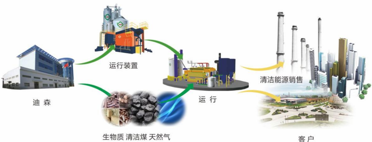
图 1：公司清洁能源投资及运营业务示意图

公司利用多种能源（天然气、生物质、清洁煤、电）和多种供能、节能设备（锅炉、发电机组、制冷机组），根据不同地区、不同能源、环保政策及客户需求，为工业及商业用户提供热力（蒸汽、热水）、冷气、电力等多种清洁能源整体解决方案，实现区域能源的资源整合和综合利用。公司清洁能源投资及运营主要以“建设-经营-转让”（BOT）及“建设-拥有-经营”（BOO）为核心商业模式，通过与客户签订热能供应长期协议或无固定期限协议，根据客户的需要，向客户销售热力，并提供清洁能源服务。客户现场所需的能源运行装置（包括非标设计定制的生物质锅炉，及余热回收、除尘装置等辅机设备）由公司购置和建设，热力所需的天然气、生物质等燃料由公司保障。