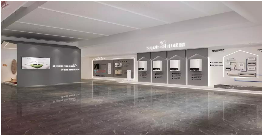
图 9：“小松鼠”产品西安体验中心