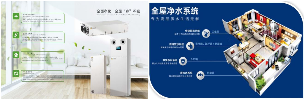
图 7：新风净水解决方案示意图

报告期内，公司始终注重产品质量，以技术驱动产品创新，以信息化、智能化保证产品质量，旗下“小松鼠”壁挂炉实现总销量突破 200 万台，“小松鼠”荣获“2019 年度中国家电磐石奖之卓越品质奖”“2019 年度中国家电磐石奖之渠道价值奖”等荣誉。