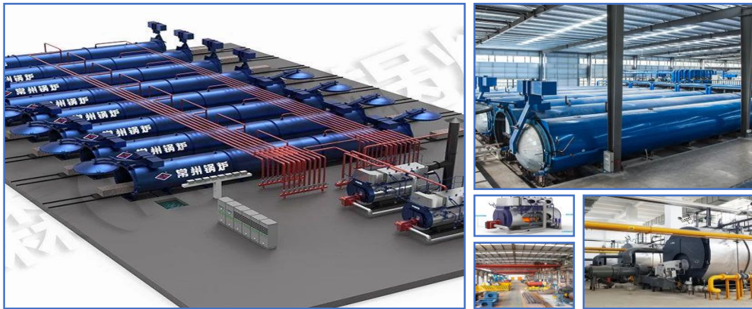
图 5：迪森锅炉节能减排个性化解决方案示意图