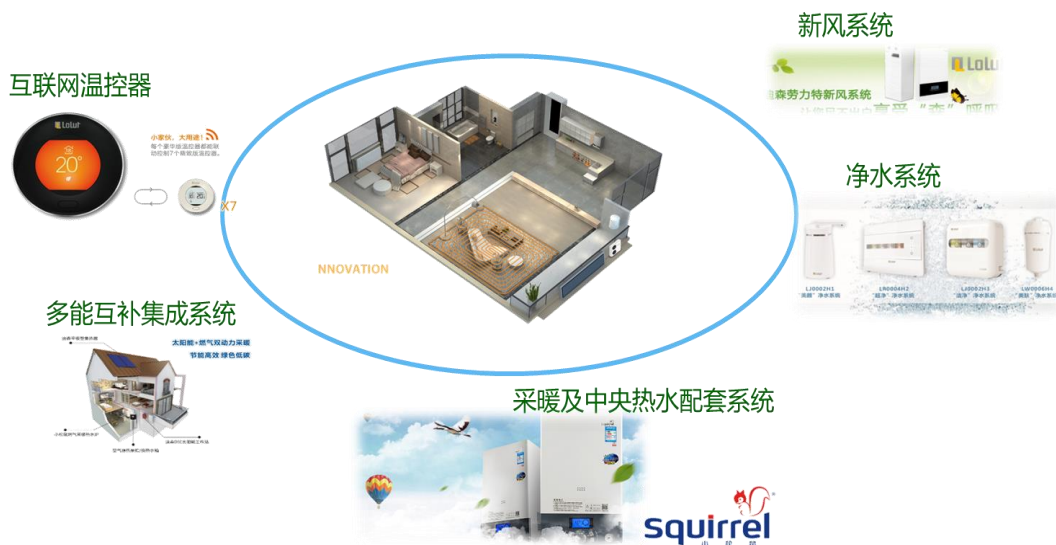
图 6：智能舒适家居制造及服务示意图

公司智能舒适家居领域涵盖壁挂炉、空气源热泵、新风机、净水机等产品。全资子公司迪森家居以“冷、暖、风、水、智”为理念，致力于为家庭用户提供健康、舒适、智能的家居系统解决方案。