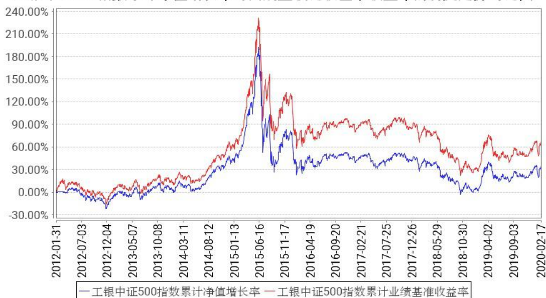
工银中证500指数累计净值增长率与同期业绩比较基准收益率的历史走势对比图