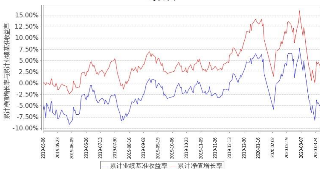
嘉实长青竞争优势股票C累计净值增长率与同期业绩比较基准收益率的历史走势对比图