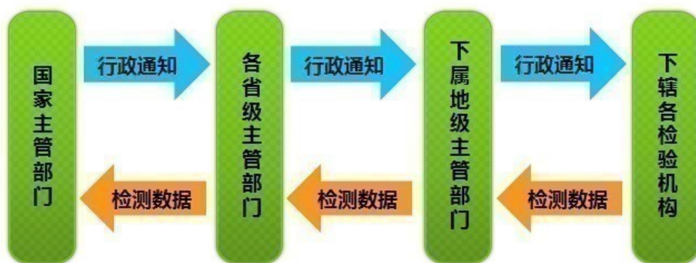
行业联网监督与管理的模式的示意图

(2) 联网监督与管理目前主要在地级行政区开展，大部分省级行政区及部分发达城市已在使用或建设全省安检联网监管系统，联网监督与管理的模式正在各地级行政地区全面推广，并逐渐延伸至全省的联网监管。