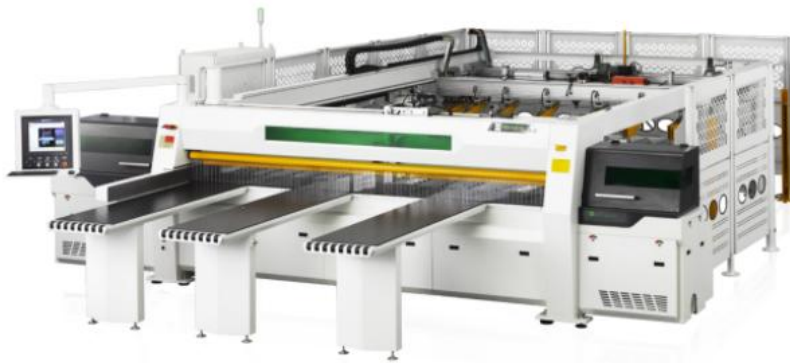
双推手后上料高速电脑裁板锯