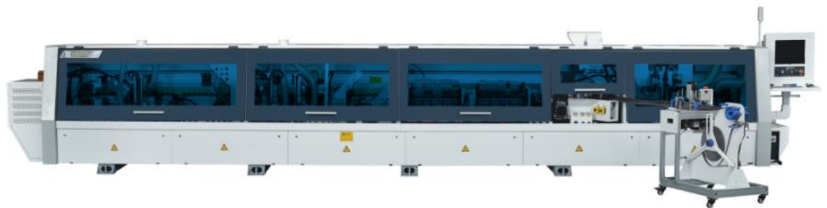
软成型自动封边机