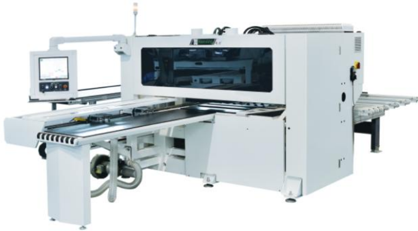
六面数控钻孔中心