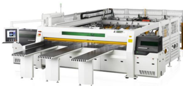
双推手后上料高速电脑裁板锯