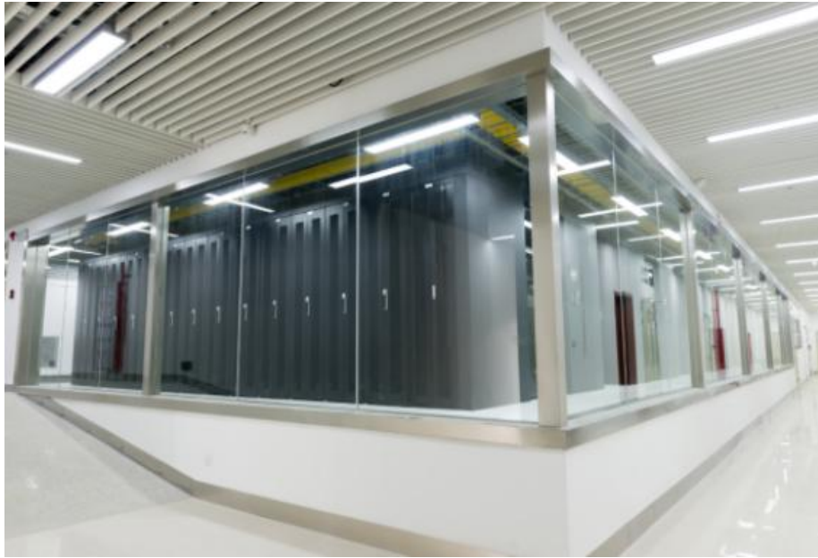
唯一·志享（华南）数据中心