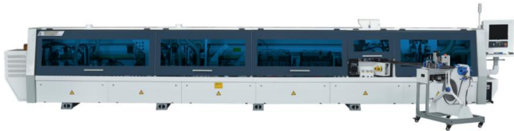
软成型自动封边机