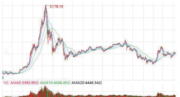
图 1：2014-2019 上证综合指数变化趋势图

证券行业的运营表现与宏观经济环境高度相关。2016 年底，中央经济工作会议定调，要稳中求进、去杠杆，大力发展实体经济，2017 年 A 股出现慢牛格局。2017 年全年，上证指数全年振幅 13.98%，截至 2017 年末，上证综指收盘收于 3,307.17 点，较年初上涨 6.56%。2018 年，受中美贸易战、国内经济增速放缓等内外部因素影响，上证综指震荡下跌，截至 2018 年末，上证综指收盘于 2,493.90 点，较年初下跌 24.59%。2019 年以来，国内财政政策整体趋于宽松，市场情绪回暖，风险偏好提升，但结构性问题依然存在，国内外环境呈现不确定性，A 股市场一季度呈现活跃，之后受到国内外宏观因素的影响出现持续波动，但市场行情总体回暖，年末上证综指收于 3,050.12 点，较上年末涨幅 22.30%。