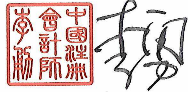
中国注册会计师：李 勇 （项目合伙人）