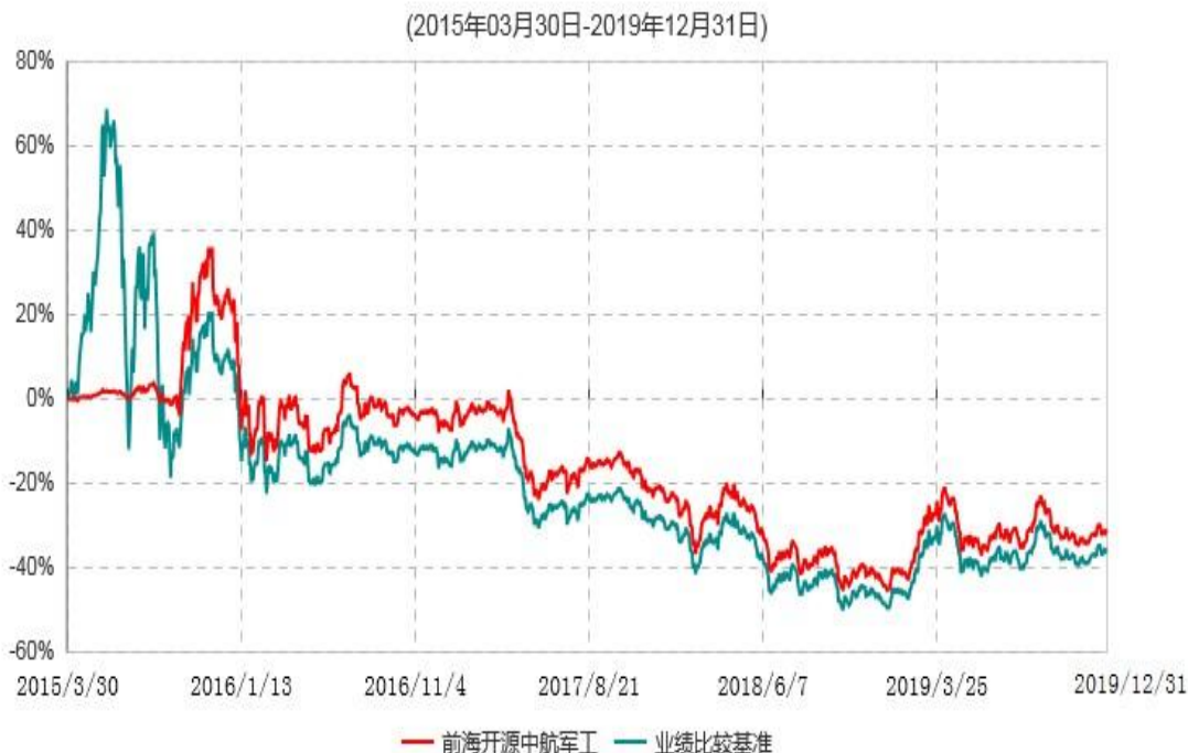
前海开源中航军工指数分级证券投资基金累计净值增长率与业绩比较基准收益率历史走势对比图