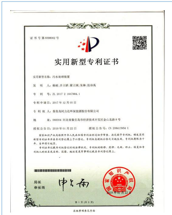
2019 年 1 月，取得污水处理装置实用新型专利