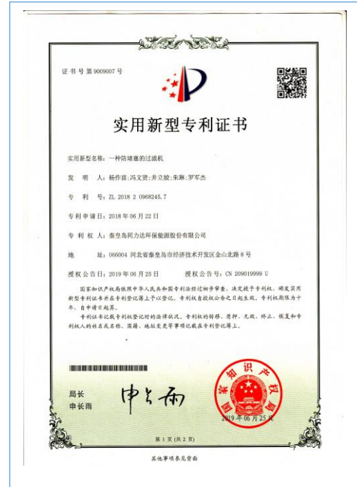
2019 年 6 月，取得一种防堵塞的过滤机实用新型专利