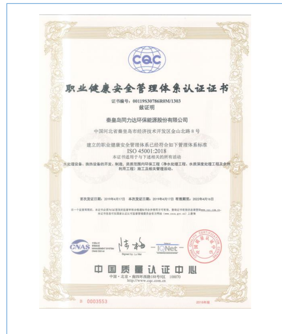
2019 年 4 月，取得 ISO45001:2018 证书