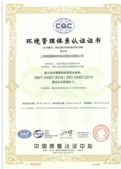
环境管理体系认证证书