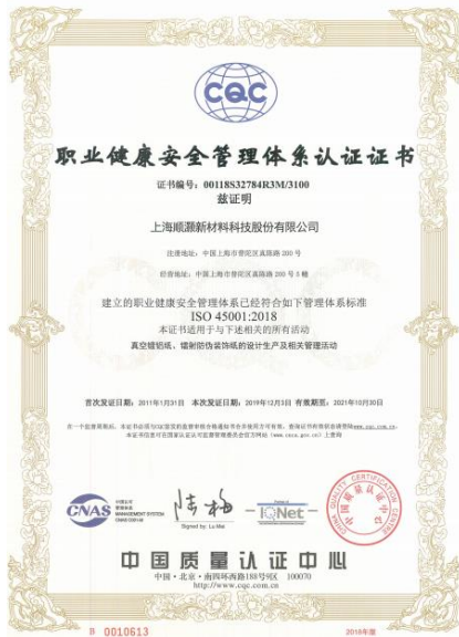
职业健康安全管理体系认证证书

公司建立职业健康安全(ISO45001-2018)管理体系，围绕职业健康安全管理方针：“致力于污染及安全预防，不断提升环境及职业健康安全绩效；关注环境和职业健康安全风险变化，保持危机和变革意识，走可持续发展之路。”展开职业健康安全全面管理。