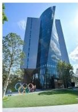
东京奥运会行政中心