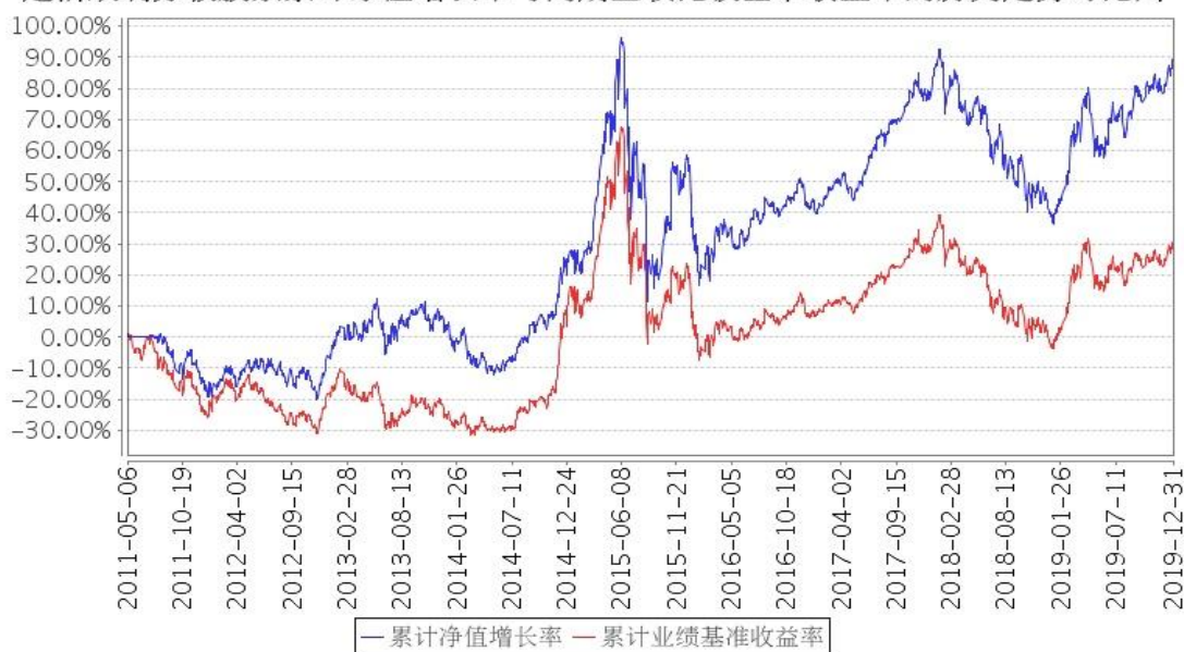
建信双利分级股票累计净值增长率与同期业绩比较基准收益率的历史走势对比图