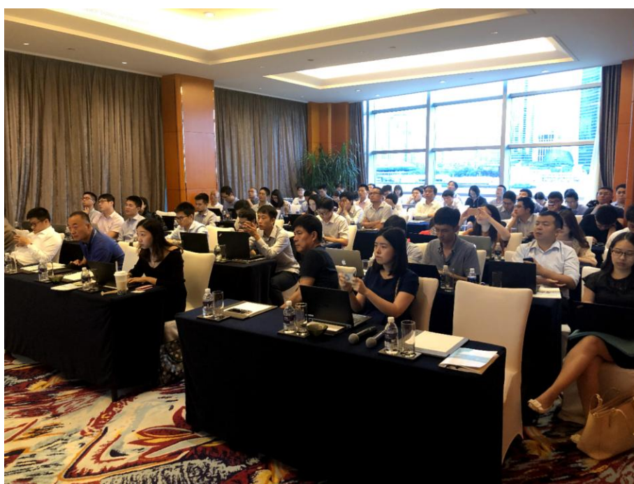
2019年9月5日，公司在上海举行路演活动