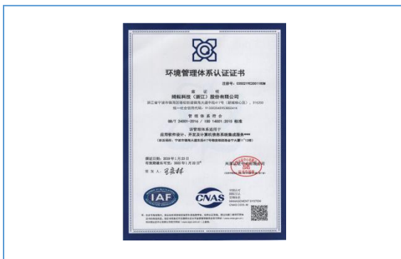
通过环境管理体系认证