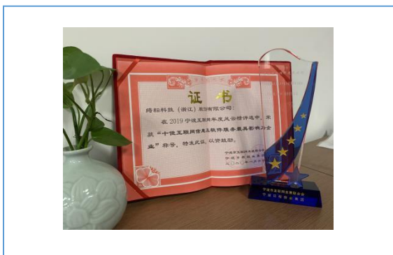
荣获 2019 年度宁波互联网风云榜十佳软件服务最具影响力企业