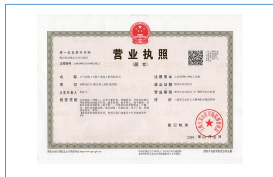
同天气在线合资成立上海合资公司