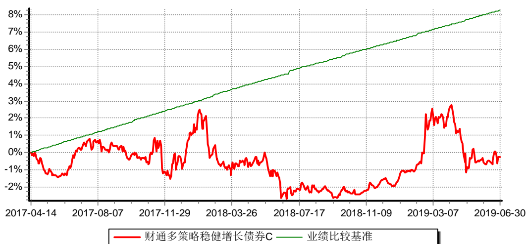
财通多策略稳健增长债券型证券投资基金C 累计净值增长率与业绩比较基准收益率历史走势对比图 (2017年4月14日-2019年6月30日)