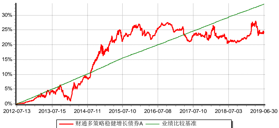
财通多策略稳健增长债券型证券投资基金A 累计净值增长率与业绩比较基准收益率历史走势对比图 (2012年7月13日-2019年6月30日)