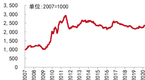
图3 中药材价格指数综合 200