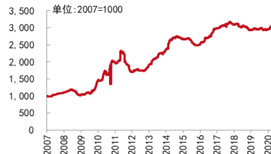
图4 中药材价格指数野生 99