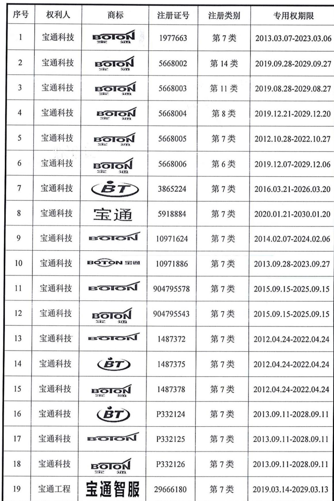
附表一：发行人及其控股子公司拥有的商标专用权