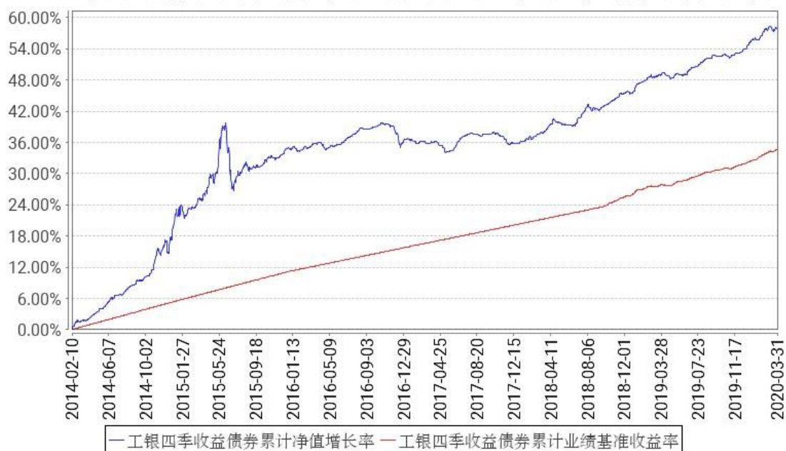
工银四季收益债券累计净值增长率与同期业绩比较基准收益率的历史走势对比图