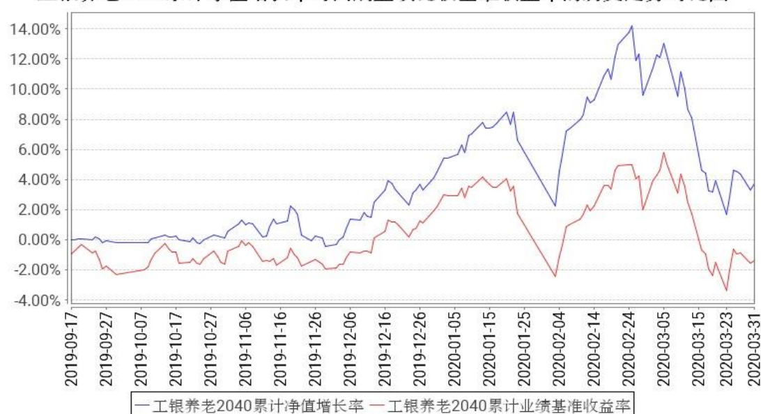
工银养老2040累计净值增长率与同期业绩比较基准收益率的历史走势对比图

注：1、本基金基金合同于2019年9月17日生效。截至报告期末，本基金基金合同生效不满一年。