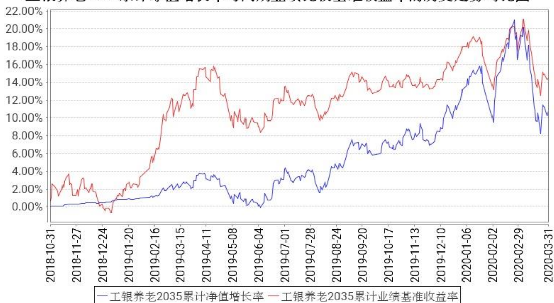
工银养老2035累计净值增长率与同期业绩比较基准收益率的历史走势对比图