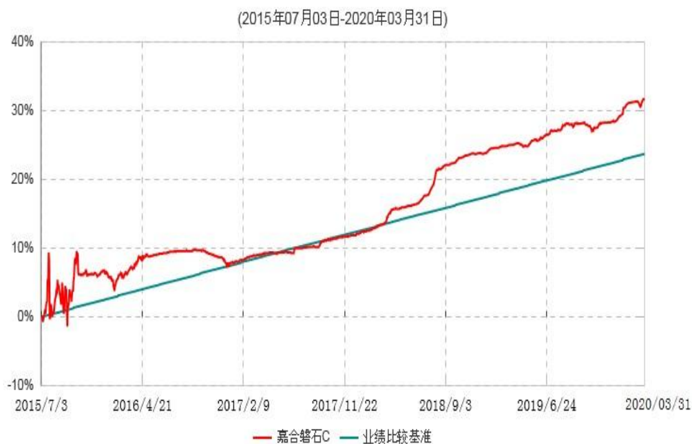
嘉合磐石C累计净值增长率与业绩比较基准收益率历史走势对比图