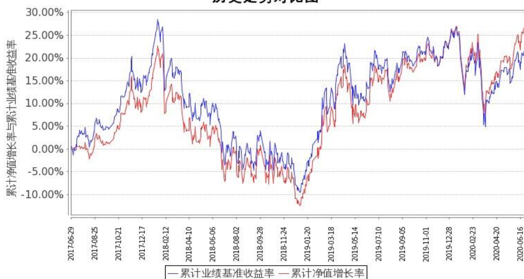
图 1：嘉实富时中国 A50ETF 联接基金 A 基金份额累计净值增长率与同期业绩比较基准收益率的历史走势对比图 (2017 年 6 月 29 日至 2020 年 6 月 30 日)