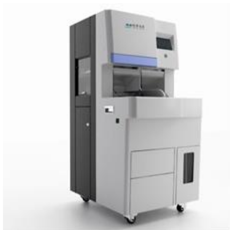
DC-1 全自动真空采血管脱盖机

基于疫情和流行病的特征和新需求，公司市场和研发团队积极收集用户反馈，走访市场调研立项，开发新产品以满足更高用户和市场需求。同时，在疫情严峻期间，公司工程师团队依然冒着风险，勇敢逆行，奔赴一线。疫情第一时间为用户完成装机、培训，为检验科和检验人员保驾护航，赢得口碑。