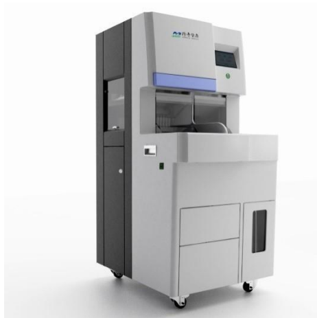
DC-1全自动真空采血管脱盖机

基于疫情和流行病特征和新需求，公司市场和研发团队积极收集用户反馈，走访市场调研立项，开发新产品以满足用户和市场需求。同时，在疫情严峻期间，公司工程师团队依然冒着风险，勇敢逆行，奔赴一线。疫情第一时间为用户完成装机、培训，为检验科和检验人员保驾护航，赢得口碑。