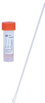
样本保存液和配套拭子

样本保存液是一种用于运送和短时间储存鼻咽部拭子样本或特定样本的培养基，可用于流感病毒等鼻咽部病原体标本的采集、保存和运输，目前主要包含非灭活型样本保存液和灭活性样本保存液，其与植绒取样拭子配套使用。报告期内，样本保存液国内外需求大增。公司通过开发新供应商和自行开模解决材料供应不足等问题，实现生产自动化，产能大幅提升。