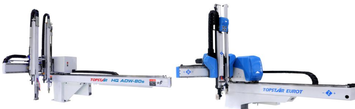
图2：XYZ三向伺服控制五轴机械手

2) 直角坐标机器人产品描述： 直角坐标机器人又称为机械手，它能够实现自动控制的、可重复编程的、运动自由度间成空间直角关系的、多用途的操作机。公司自主研发、生产的直角坐标机器人采用伺服马达驱动，使用皮带、齿轮、齿条进行传动，并配备高精密线性滑轨以导向运行，使产品具有定位精准、运动速度快、运行稳定等特点，可应用于直线、平面、立体的工件搬运移栽、检测定位、自动装配等工序。