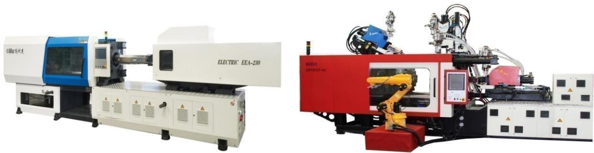
图3：公司的注塑机产品节选

自动供料系统是公司根据客户厂房环境、现场机台的摆放情况和现场原料用料情况，结合公司自产的各类特有注塑机、配套设备及直角坐标机器人，设计的一种能够实现全厂无人化不间断作业的生产车间整体解决方案。该系统采用工业电脑自动对所有机台进行集中控制，实现了对所有用料单元的24小时连续自动化供料作业，配合系统中各注塑机配套设备的不同功能，实现“原料→储存→计量→干燥→输送→成型→物流”全过程的自动化生产。