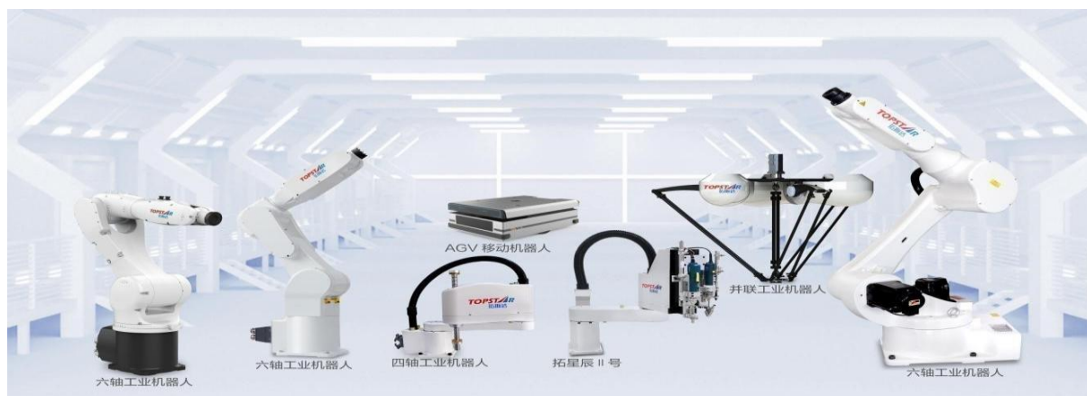
图1：公司的多关节机器人产品节选

2) 直角坐标机器人产品描述： 直角坐标机器人又称为机械手，它能够实现自动控制的、可重复编程的、运动自由度间成空间直角关系的、多用途的操作机。公司自主研发、生产的直角坐标机器人采用伺服马达驱动，使用皮带、齿轮、齿条进行传动，并配备高精密线性滑轨以导向运行，使产品具有定位精准、运动速度快、运行稳定等特点，可应用于直线、平面、立体的工件搬运移栽、检测定位、自动装配等工序。