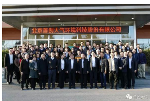
重组一周年 亮出成绩单 首创大气公司 2020 年工作会召开