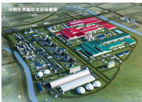
总投超 4 亿，首创大气又拿下钢铁冶金行业 大气治理 BOT 大单