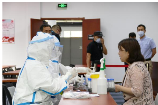
多措并举筑牢疫情防线 科学防控彰显人文关怀