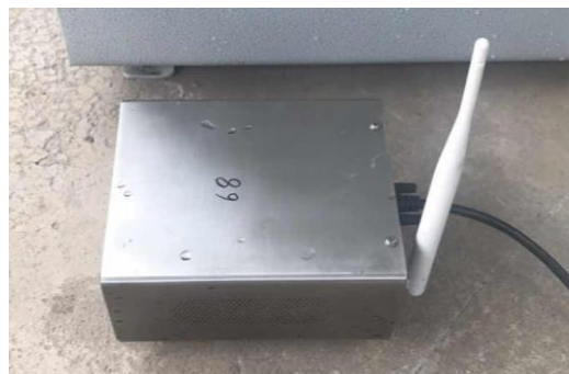
“首都蓝天行动”项目进行科技成果转化