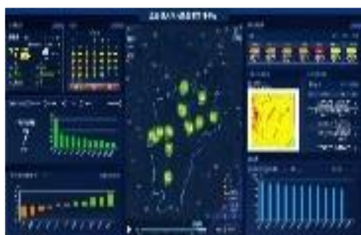
6310.84 万元中标 定州市大气污染防治项目