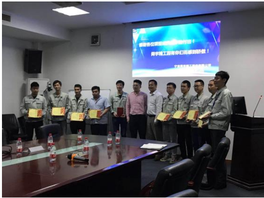
3 月份 UV 小盒项目试制成功，得到客户肯定