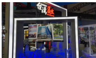
中国国际进口博览会