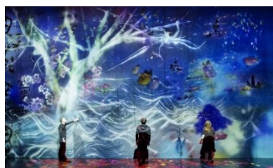
广州 teamLab 沉浸式新媒体大展