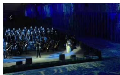
杨浦滨江城市艺术季