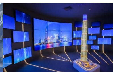
上海中心观光体验厅