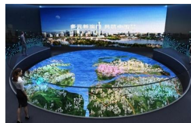
澳门城市发展展示中心