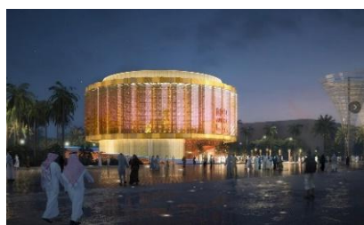
迪拜世博会中国馆