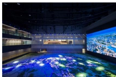
广州规划展览中心