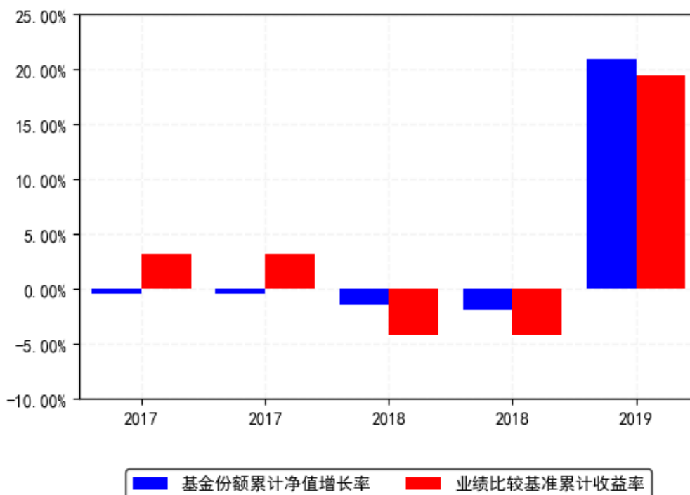
美国REIT每年净值增长率与同期业绩比较基准收益率的对比图（2019年12月31日）