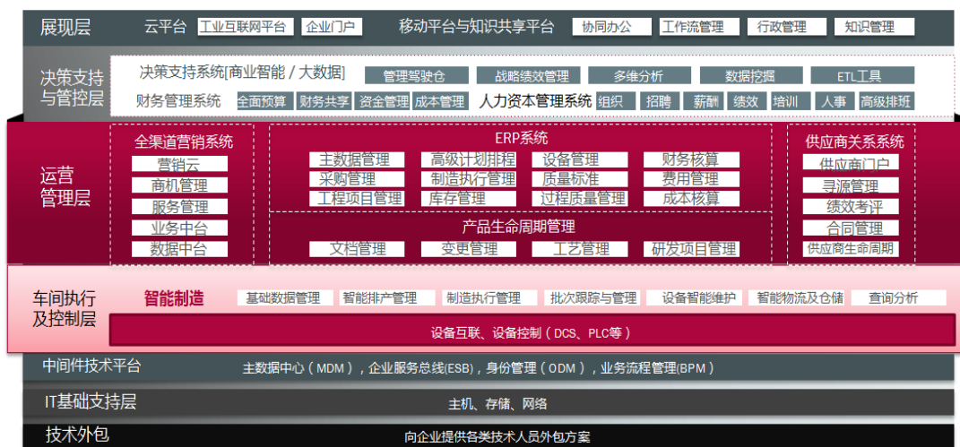
赛意信息360° 数字化及智能制造解决方案全景图

在十多年的快速发展过程中，公司积累了丰富的解决方案及众多的行业客户案例，成功为超过千家来自于制造、零售、服务等行业的企业级客户提供了丰富而具有竞争力的数字化转型服务，拥有华为技术、美的集团、华润集团、深南电路、立白集团、大自然家居、视源股份等众多优质客户。公司的产品及解决方案顾问团队在企业数字化转型过程中的规划咨询、方案设计、系统实施、应用集成及设备互联等领域具有丰富的实施经验，技术研究团队始终紧跟技术发展趋势，熟悉并掌握云、大数据、物联网、移动互联网等新一代信息技术，使公司的产品与服务具备了持续创新能力与市场竞争力。