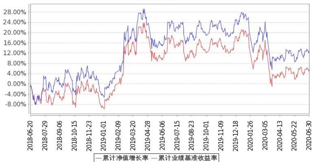
图 2：嘉实中证金融地产 ETF 联接 C 基金份额累计净值增长率与同期业绩比较基准收益率的历史走势对比图