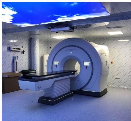
图为 TOMO 刀

友方医院 2020 年上半年实现收入 3453 万元，同比仅下降 9%。其中二季度开始恢复良好，Q2 收入同比增长 2%，环比增长 20%，净利润同比增长 26%，环比增长 117%。友方医院依托已有的肿瘤放疗设备在当地的领先优势（伽玛刀放疗人数等在重庆地区处于领先地位），进一步引入高端设备：PHILIPS Prodiva 1.5T 磁共振和 PET-CT，完善前端肿瘤筛查能力，并新购置 TOMO 刀，上述设备将进一步提升友方医院在当地肿瘤综合治疗的影响力。